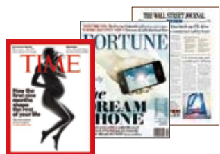
新聞・雑誌などを大幅割引で購入可能