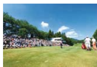
ゴルフ場を優待料金で利用可能！