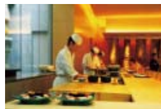
レストラン・バーでの割引サービス