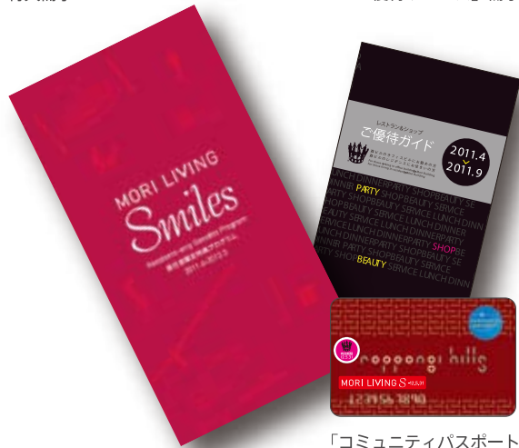
「ショップ&レストラン ご優待サービス」冊子